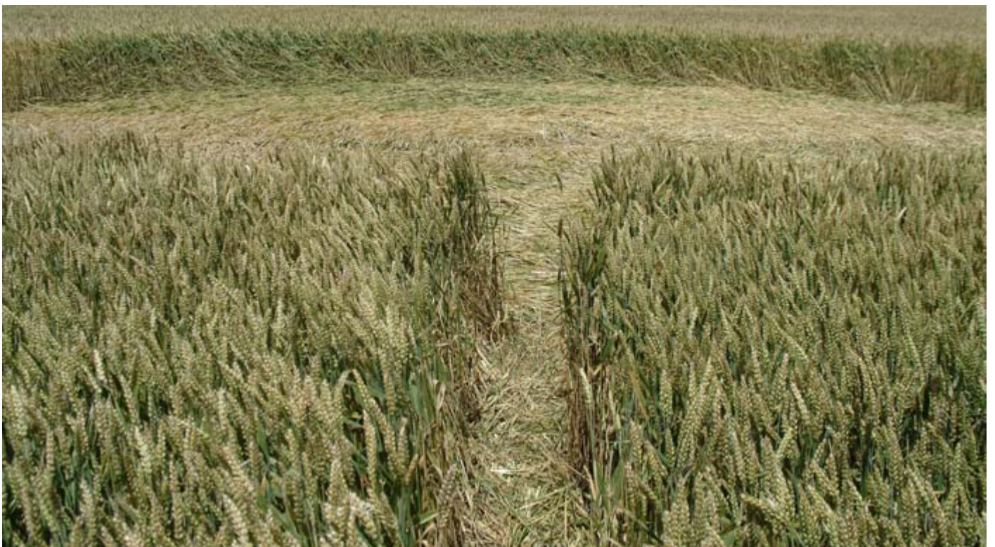
bild unten: verbindung zum linksdrehenden grossen kreis (d = ca 12m).